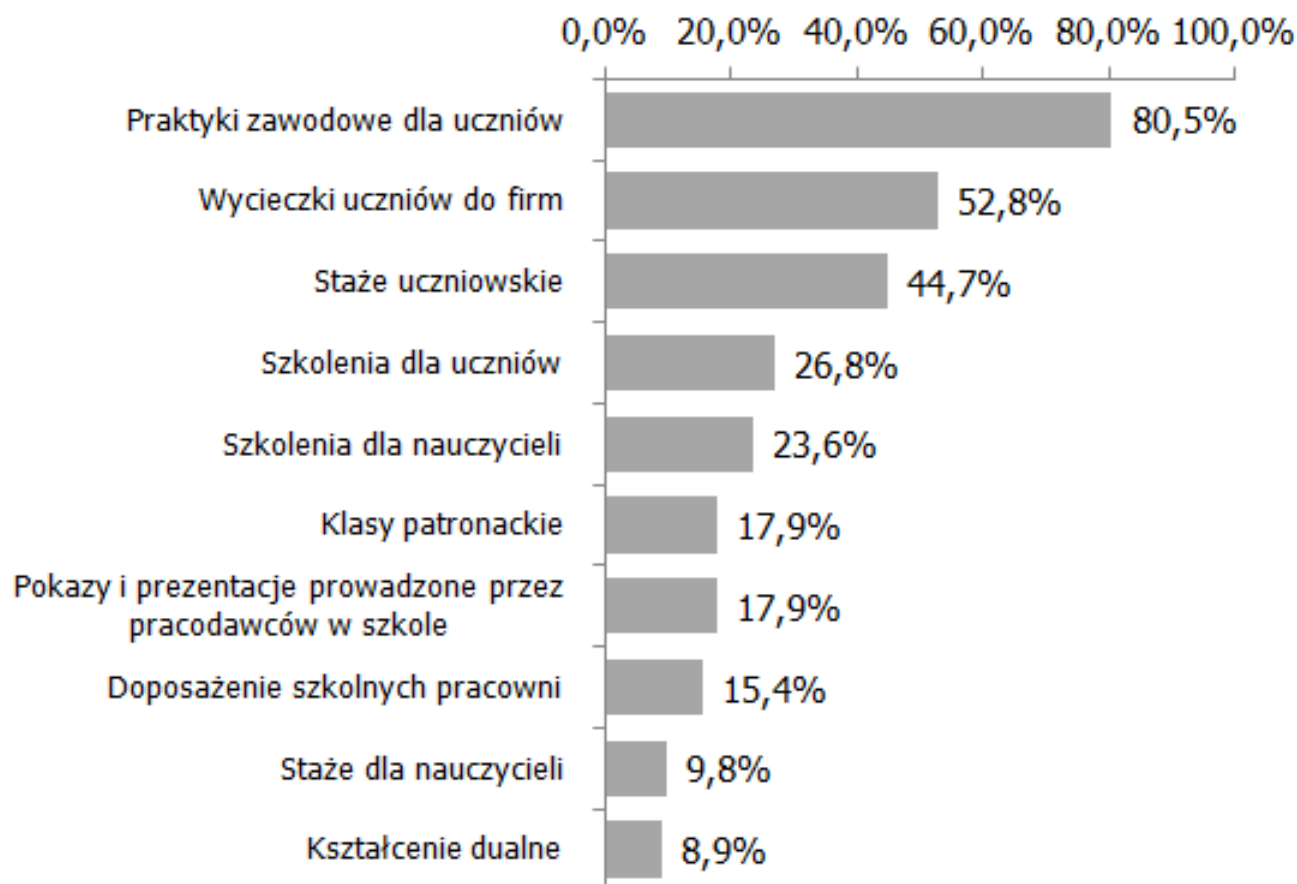
Wykres 10. Na czym ta współpraca polega? N=123